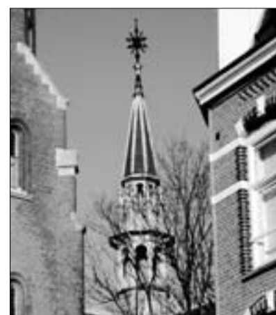
2e vd Helststraat

Het Afrika Huis (links) wenst u allen ‘Geseende kerfees en ‘n gelukkige nuwe jaar.’