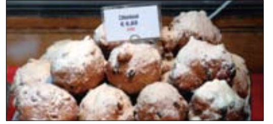
Feesten in De Pijp. p.6,7

JAARGANG 36 | NUMMER 7 | DECEMBER 2006 | VERSCHIJNT ACHT KEER PER JAAR