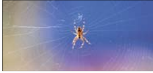
Herfst in De Pijp. p.12