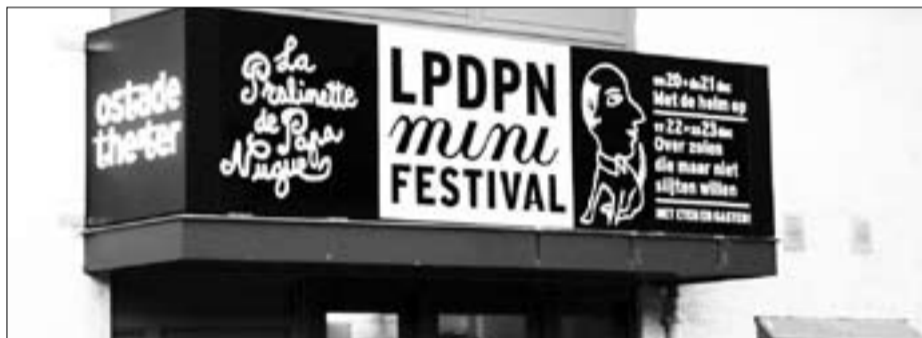
LPDNP-minifestival, La Pralinette de Papa Nugue, tjettergruppe (LPDPN): wo 20 t/m za 23 december in het Ostadetheater.