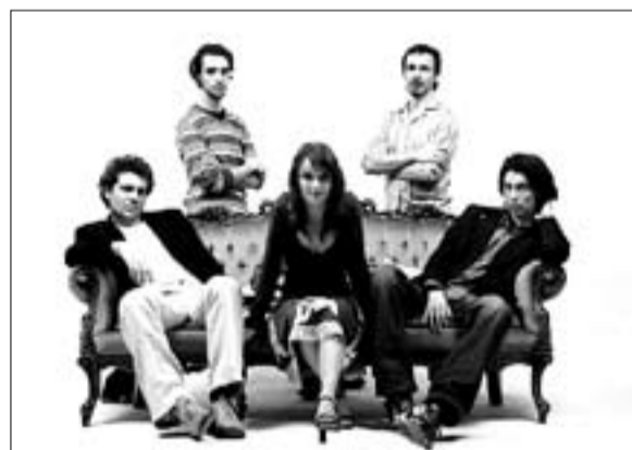
Sensuël treedt op in De Badcuyp op donderdag 21 december.

Hamond Soul Jazz Project, Aanvang: 20.00 uur. Entree gratis bij maaltijd van minimaal 9,00 euro.