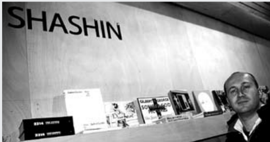
De Pijp is weer een kunstboekhandel rijker. 'Shashin' aan de Daniel Stalpertstraat 97 (bij Vintage) voert een uitgebreide collectie hedendaagse kunst. (Op de foto: een deel van het interieur met de eigenaar.)

Informatie: Buurtcentrum Quellijn, Quellijnstraat 62-66 tel. 6620667 Vragen naar: Esther van Gulick