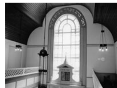
Synagoge Gerard Doustraat

een mooi effect als het licht erdoor schijnt. Ook weer een kunstproject. Het uit elkaar halen van de Bijbel wordt trouwens niet als oneerlijk gezien. De kerk is juist heel trots dat de Bijbel op deze manier tentoongesteld wordt. Een andere manier van openbaren.