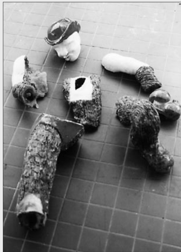
'De gevallen Engel' van Ulrike Rehm. Onder meer te zien in de tentoonstelling 'Afstuderend' t/m 31 juli in De Tribune in de Vredeskerk, Pijnackerstraat 11 op maandag t/m zaterdag van 13:30 tot 17:00.