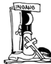
Gebedshuizen-dag p. 9