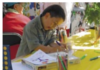
Feesten in de buurt p. 7,8