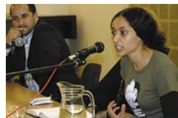
Racisme De Pijp uit! p. 12

JAARGANG 35 | NUMMER 5 | JULI 2005 | VERSCHIJNT ACHT KEER PER JAAR