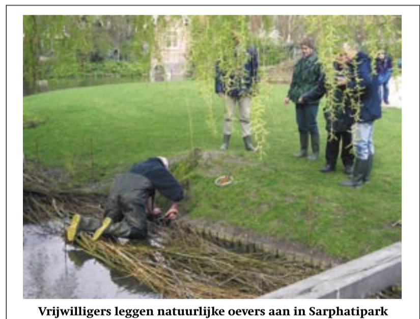
Vrijwilligers leggen natuurlijke oevers aan in Sarphatipark