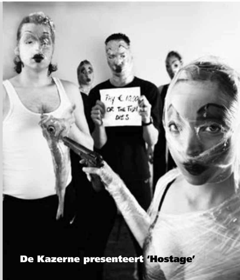
De Kazerne presenteert 'Hostage'

Rialto Filmtheater Ceintuurbaan 338 www.rialtofilm.nl Info & reserveren: 676 87 00, vanaf 13.00 uur