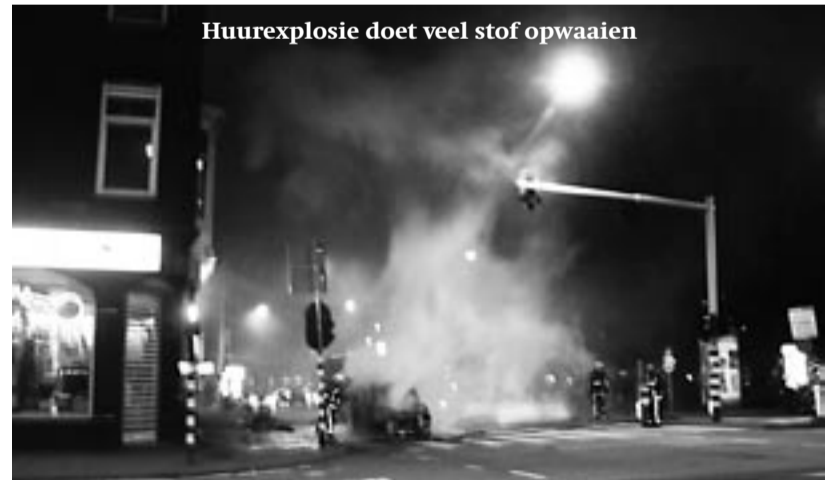
Huurexplosie doet veel stof opwaaien