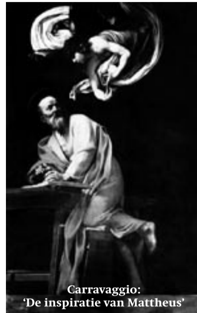
Carravaggio: 'De inspiratie van Mattheus'

Inspiratie komt van het Latijnse 'inspiratio', wat 'inblazing' betekent. In overdrachtelijke zin betekent het dat God zijn adem inblaast of in laat blazen, zoals bijvoorbeeld het geval is op een schilderij van Carravaggio dat 'de inspiratie van Mattheus' heet. Hierop krijgt Mattheus de tekst voor zijn evangelie door de adem van een engel 'ingeblazen'. En zo 'blaast' God zelf bij Mozes de tekst in voor de stenen tafelen met de tien geboden. Het ontvangen van goddelijke inspiratie is overigens niet het alleenrecht van het christendom. Al in de Oudheid blies de Griekse god Apollo zijn raadgevingen in bij het orakel van Delphi. En volgelingen van het in de zeventiende eeuw ontstane voodoo-geloof raken tijdens ceremonies onder aanmoediging van een priester of priesteres bezeten door geesten en worden op die manier 'ingeblazen'.