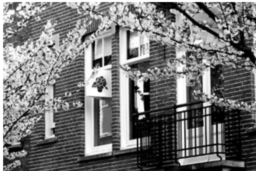
Bewoners van de Pieter Aertszstraat zetten de bloemetjes buiten: 60 geraniums op 'makelaarsborden' voor de ramen en vijf reuzebloempotten op de vensterbank.