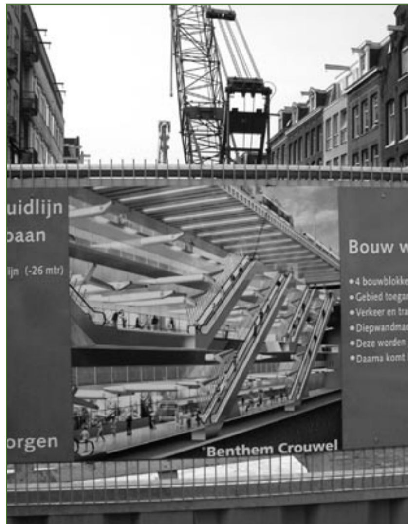
Ferdinand Bolstraat: artistieke impressie Station Ferdinand Bol