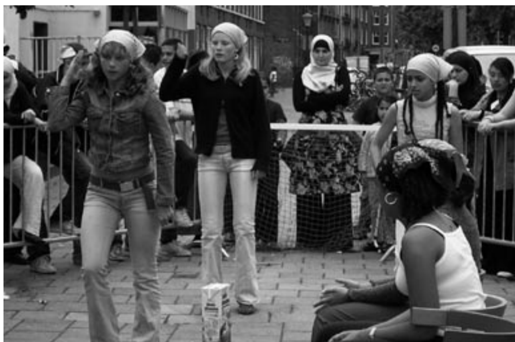
Jongeren centrum Cinetol sloot het seizoen af met spelletjes, lekker eten, muziek en street-dance.