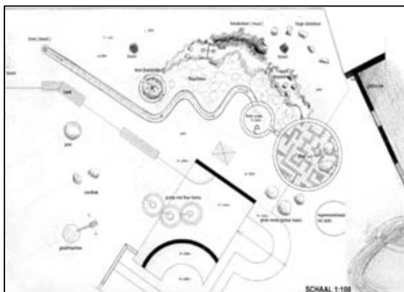
Waterspeelplaats Project 1

Voorstel 1 combineert twee waterlopen. De ene loop is lang en glad afgewerkt. De ander meer zoals een beekje in de natuur er uit zou