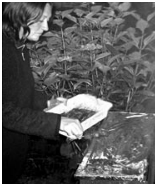
Tip: Omwikkel het barbecuooster met aluminiumfolie.

met aanmaakblokjes werken of, ook heel handig, aanmaakgel.