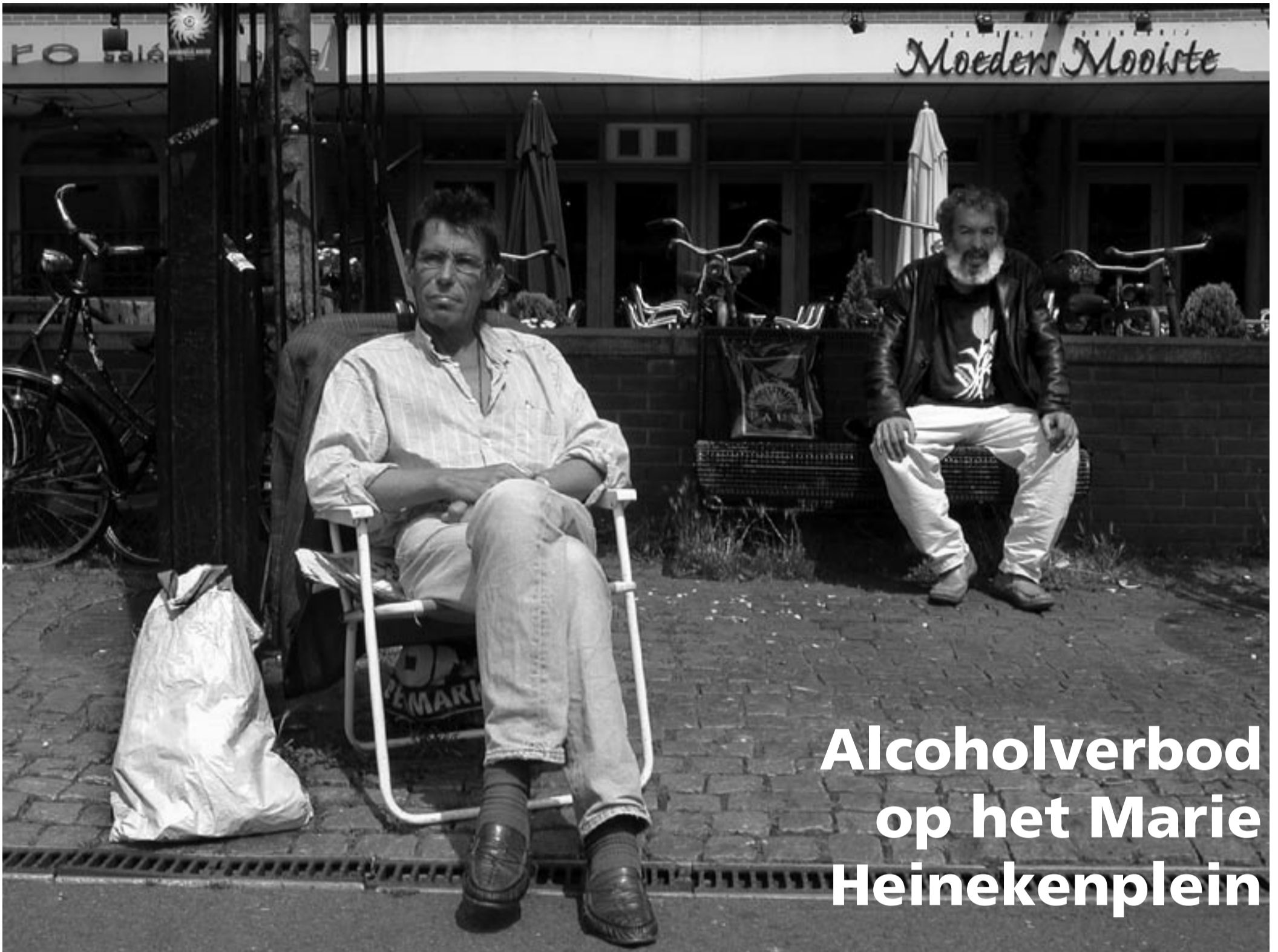
Heinekenplein, een zaterdag in augustus