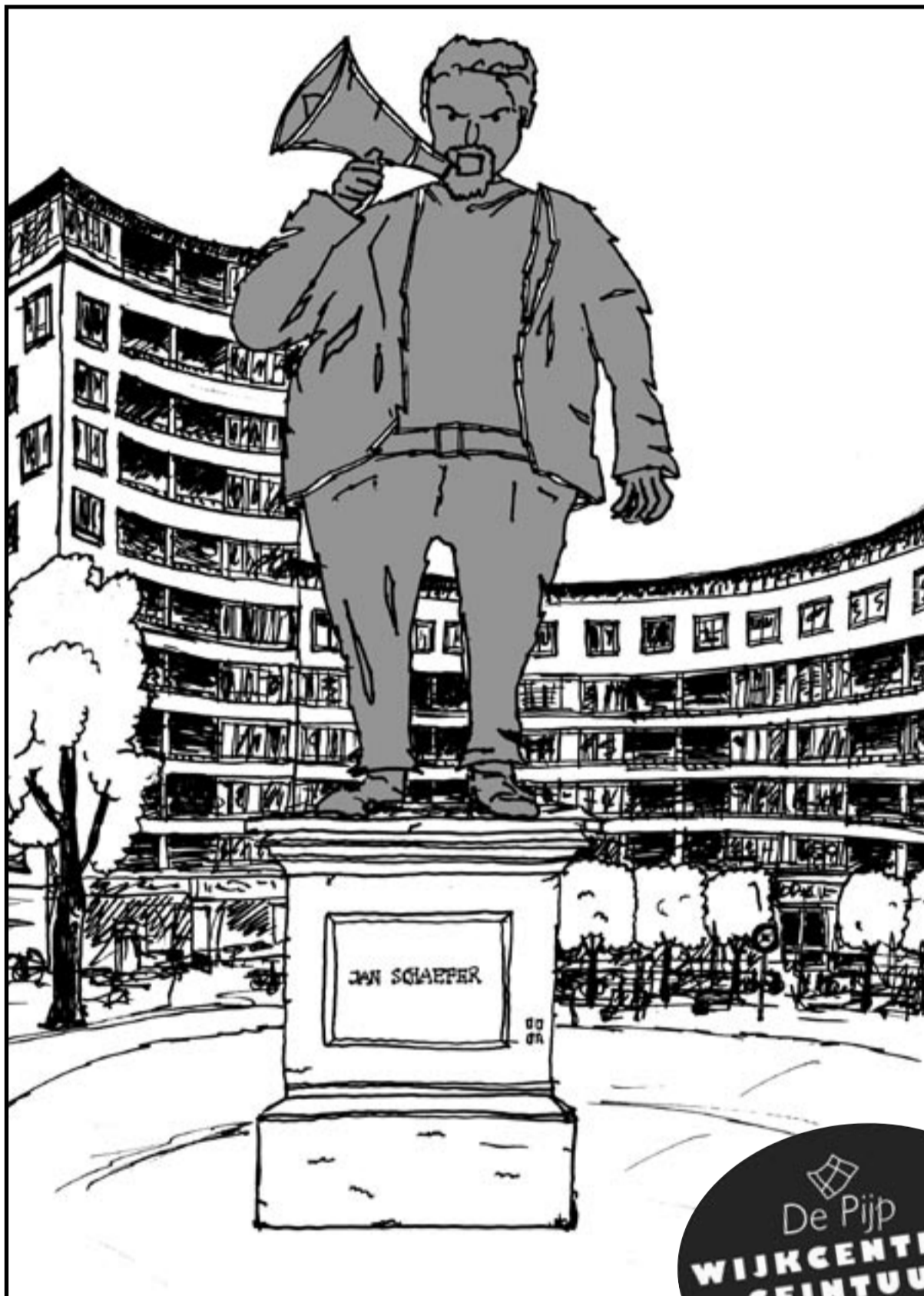
Illustratie Steven Diemel