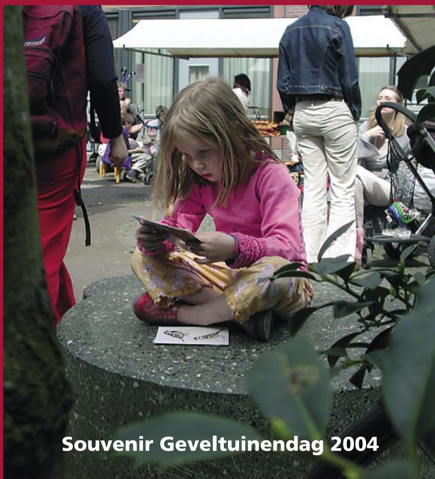
Souvenir Geveltuinendag 2004