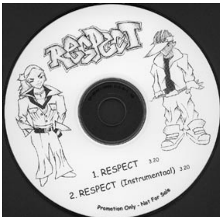
Respect: recent cd - project van Cinetol