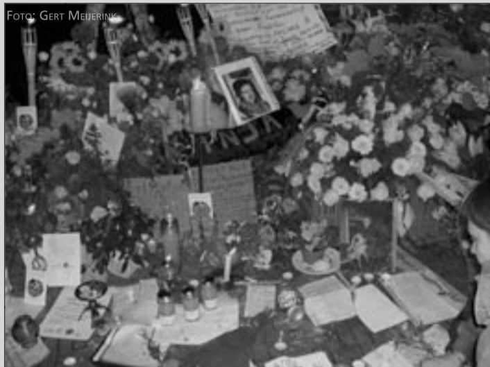
Foto voorpagina: Een monument tegen geweld op de avond van de stille tocht.